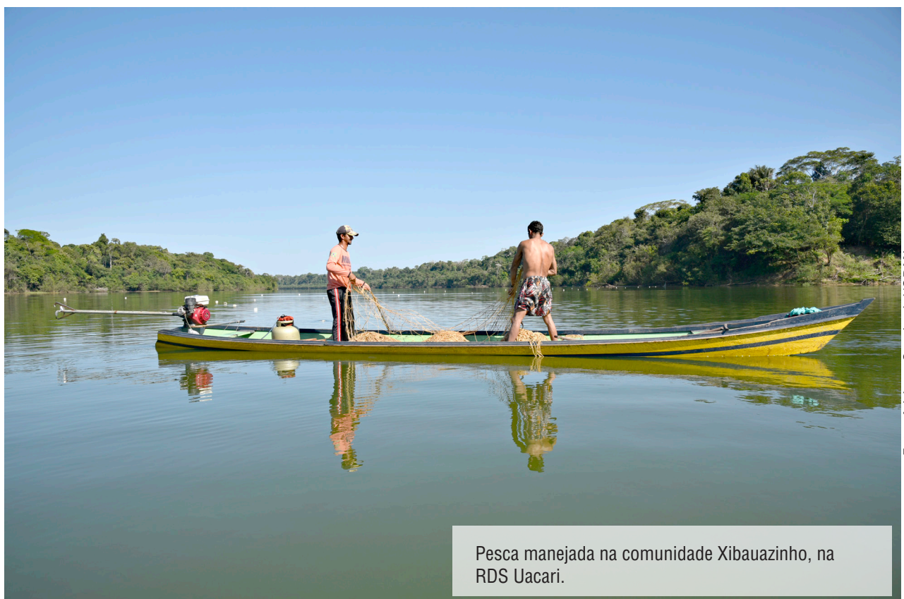
Pesca manejada na comunidade Xibauzinho, na RDS Uacari.

e Cidadania e se for aprovado lá vai para o Senado Federal e por último deve ser sancionado pela presidência da república.