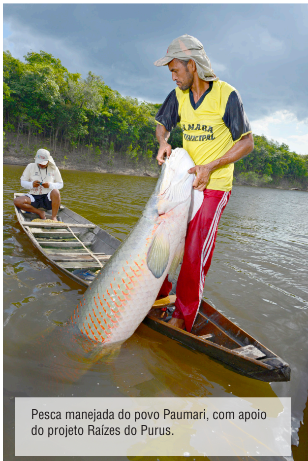
Pesca manejada do povo Paumari, com apoio do projeto Raízes do Purus.

Mesmo que seja melhor do que é hoje, nem os R$ 7,74, nem os R$ 13,50 dariam conta de pagar todos os benefícios do manejo, difíceis de serem colocados em valores financeiros, como a proteção da natureza e o benefício social e cultural deste trabalho.