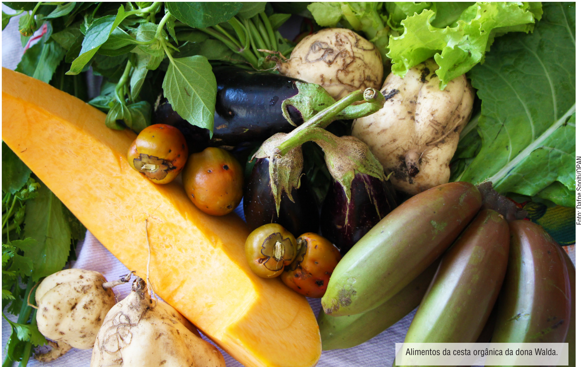
Alimentos da cesta orgânica da dona Walda.